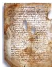
Псковская судная грамота

Двинская уставная грамота 1397 года. Мздоимство упоминается в русских летописях XIV века, например в Двинской уставной грамоте 1397 года в статье 6: «А самосуда четыре рубли, а самосуд то: кто изыснав татя с поличным, да отпустит, а себе посул возьмет, а наместники доведаются по заповеди, ино то самосуд, а опричь того самосуда нет». Там же, в статье 8: «...а черес поруку не ковати, а посула в железех не просити; а что в железех посул, то не в посул».